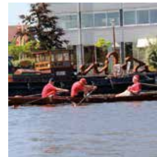
Fotografie Varen op de Zaan (van Zaandam tot Wormerveer)